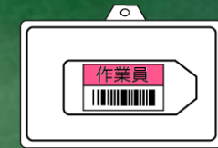
◆ICカード作業員携帯